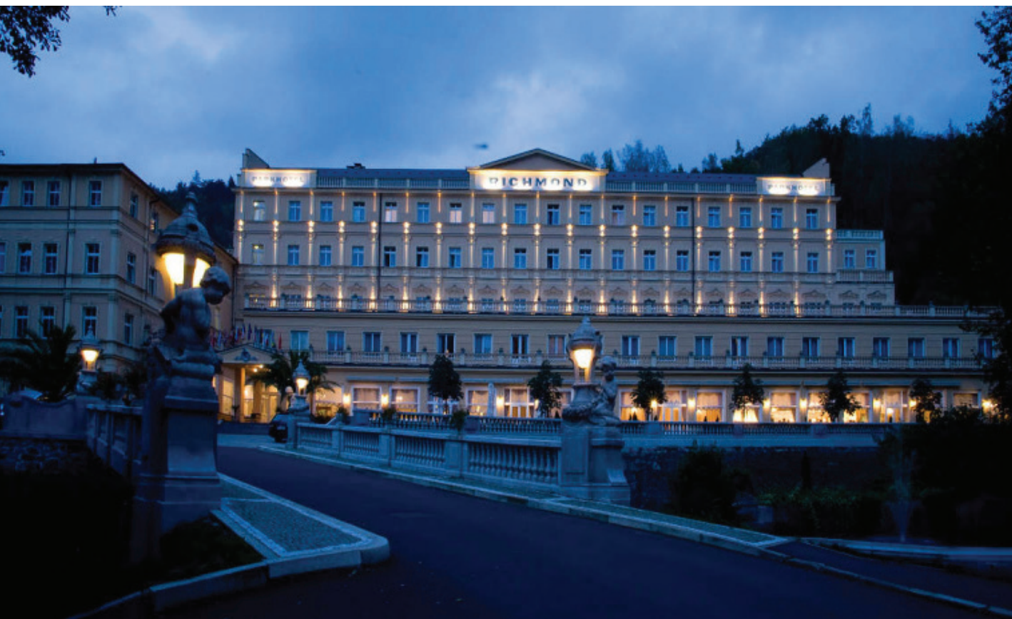
Karlovy Vary, hotel Richmond