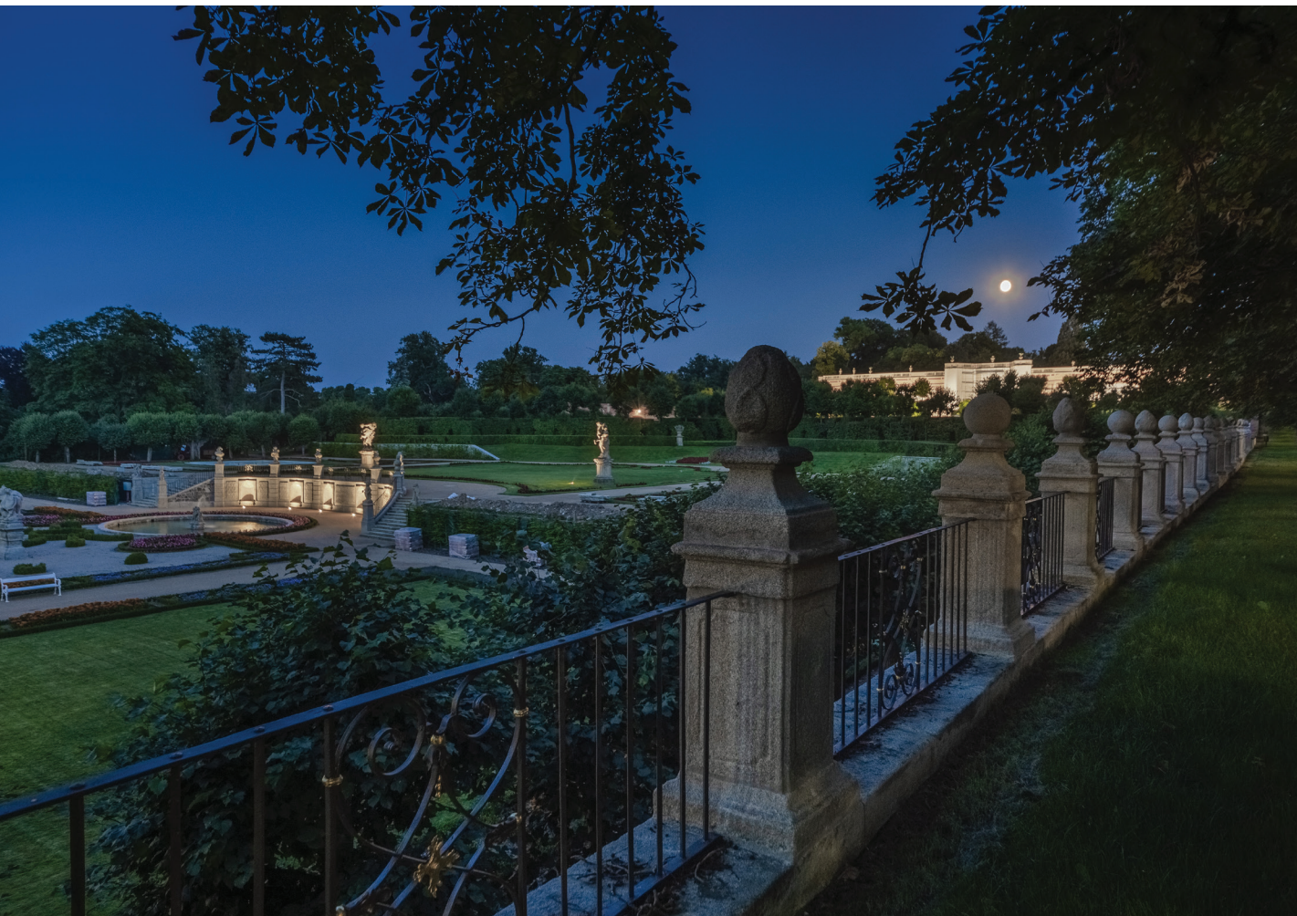
Dobříš, zámek Dobříš, francouzský park Autor: Ing. arch. Libor Sommer