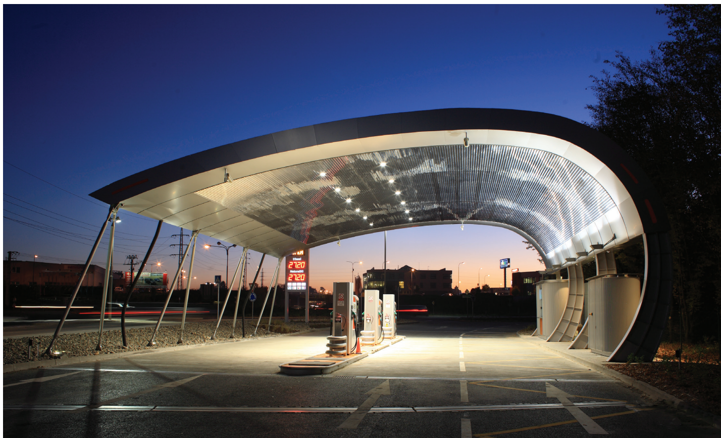
Průhonice, Tank&Go, bezobslužná čerpací stanice Autor: Ing. arch. Luboš Sekal