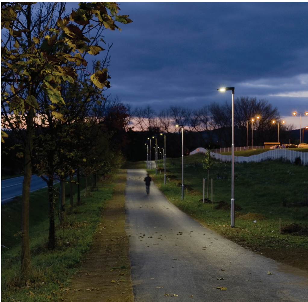
Písek, cyklostezka, veřejné osvětlení