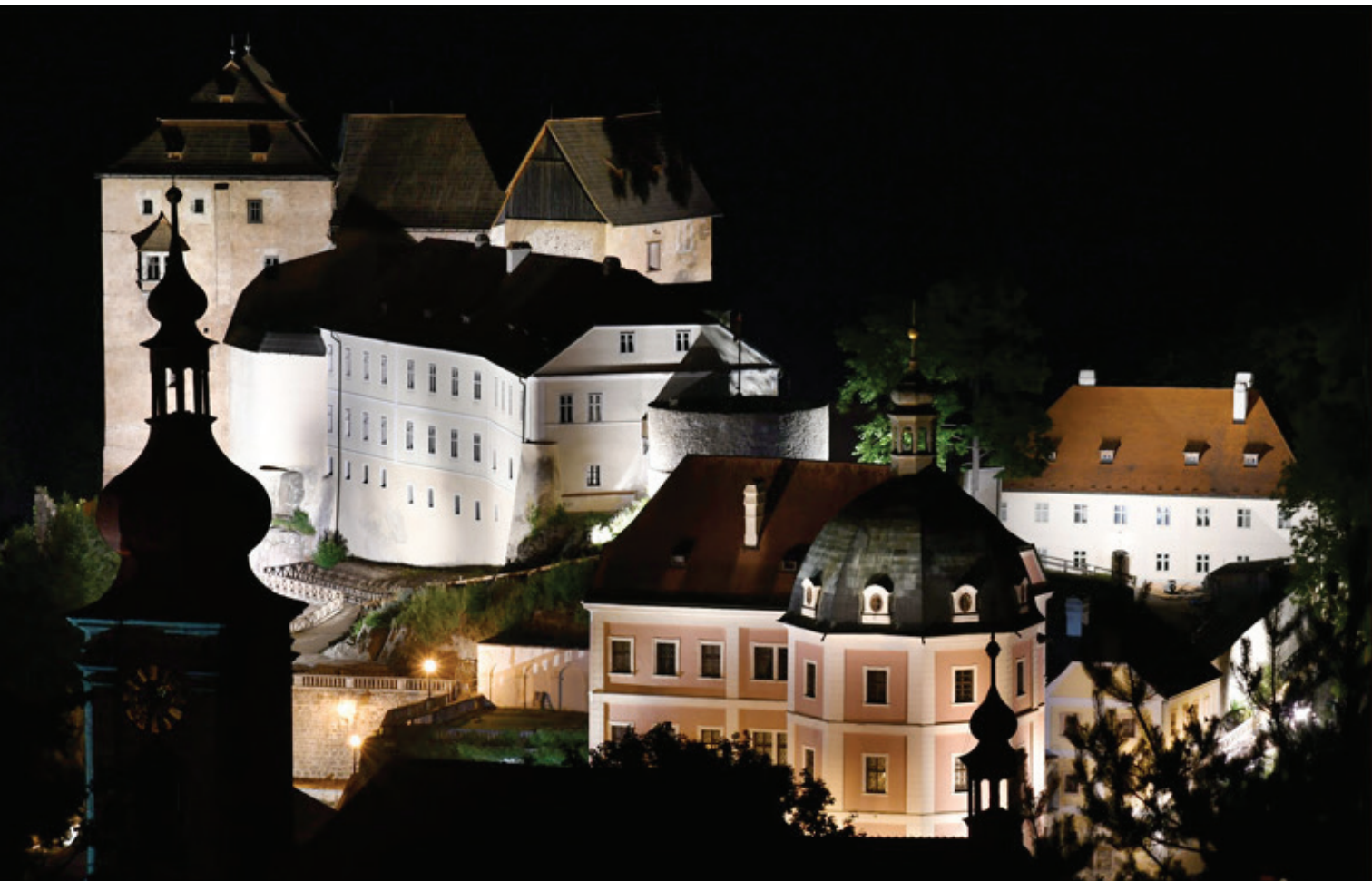
Bečov, hrad, zámek