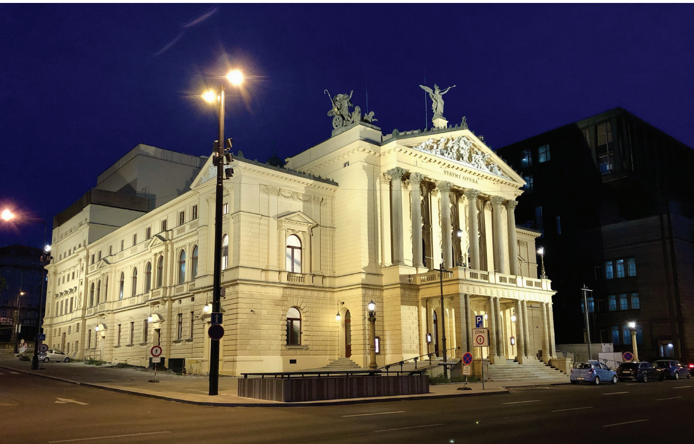
Praha, Státní opera