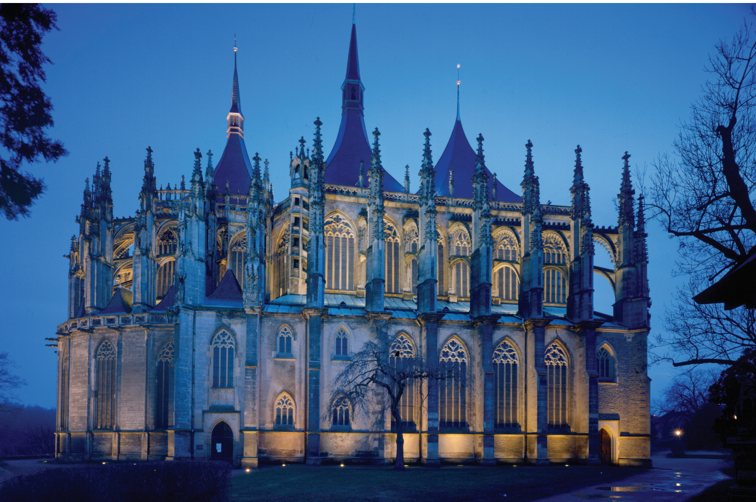
Kutná Hora, kostel sv. Barbory, Jezuitská kolej