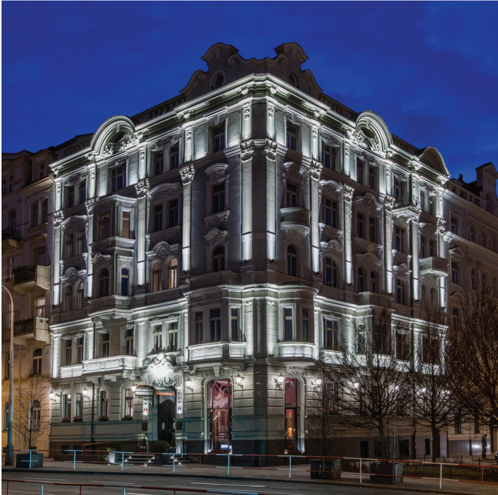
Praha, hotel Mamasion Riverside