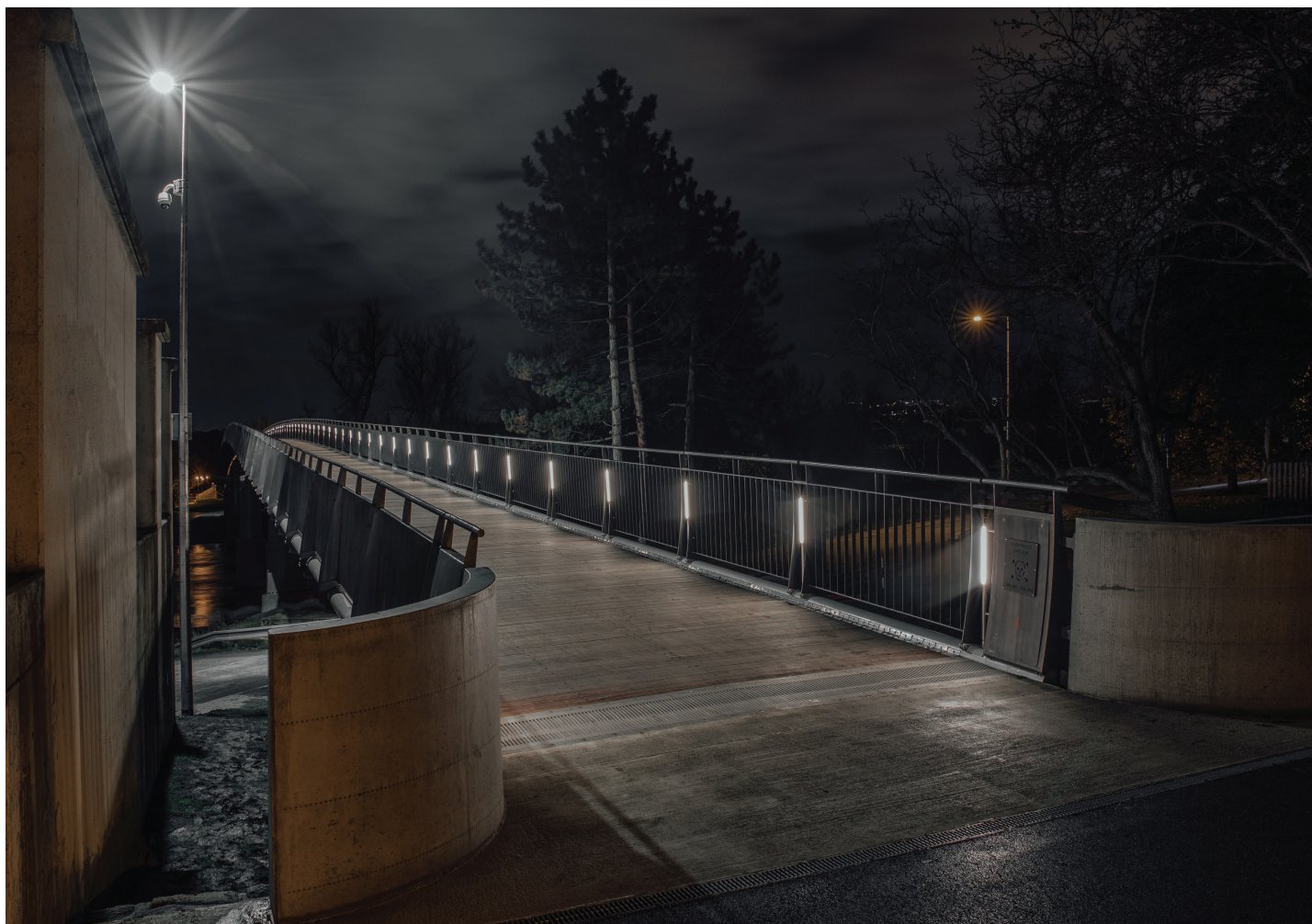
Praha, Trojská lávka Autor: Ing. arch. Akad. arch. Libor Kábrt