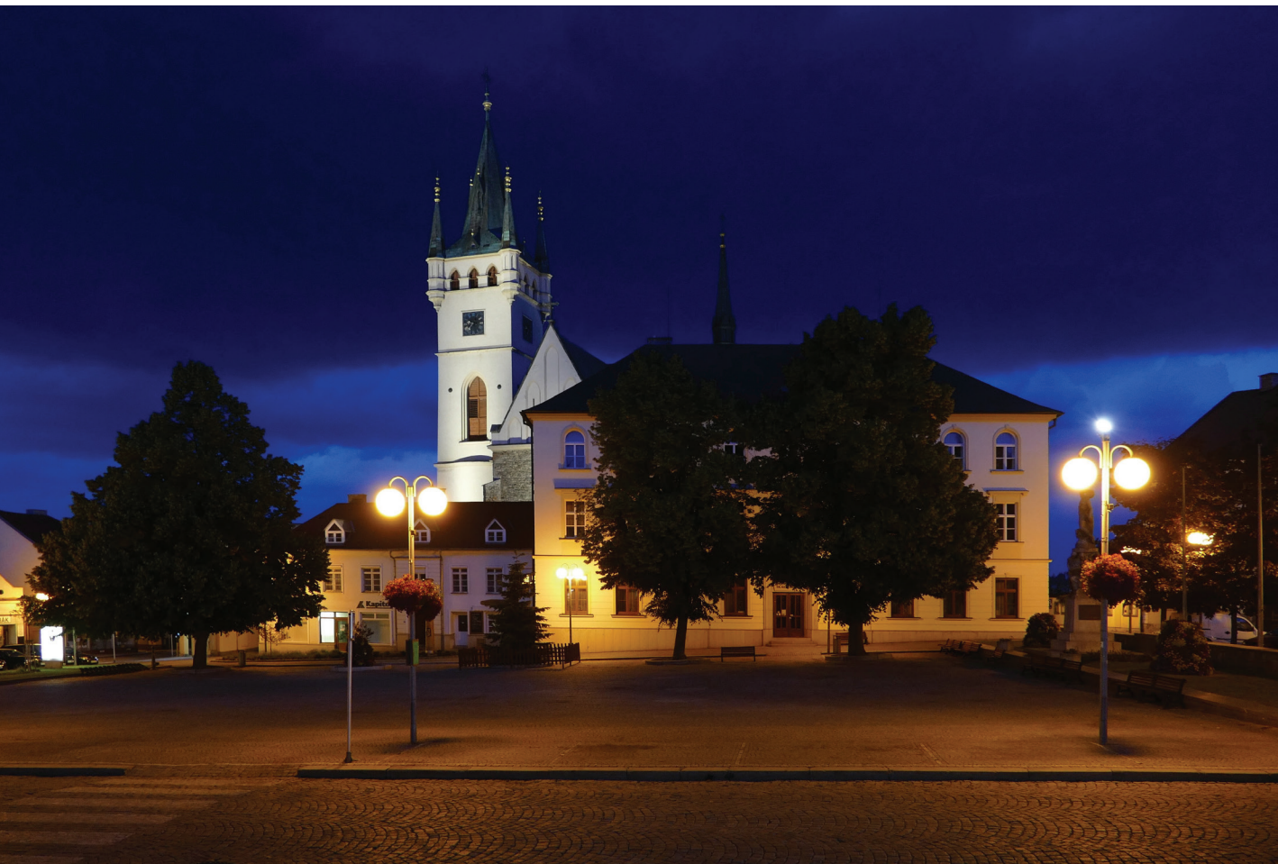
Humpolec, kostel sv. Mikuláše