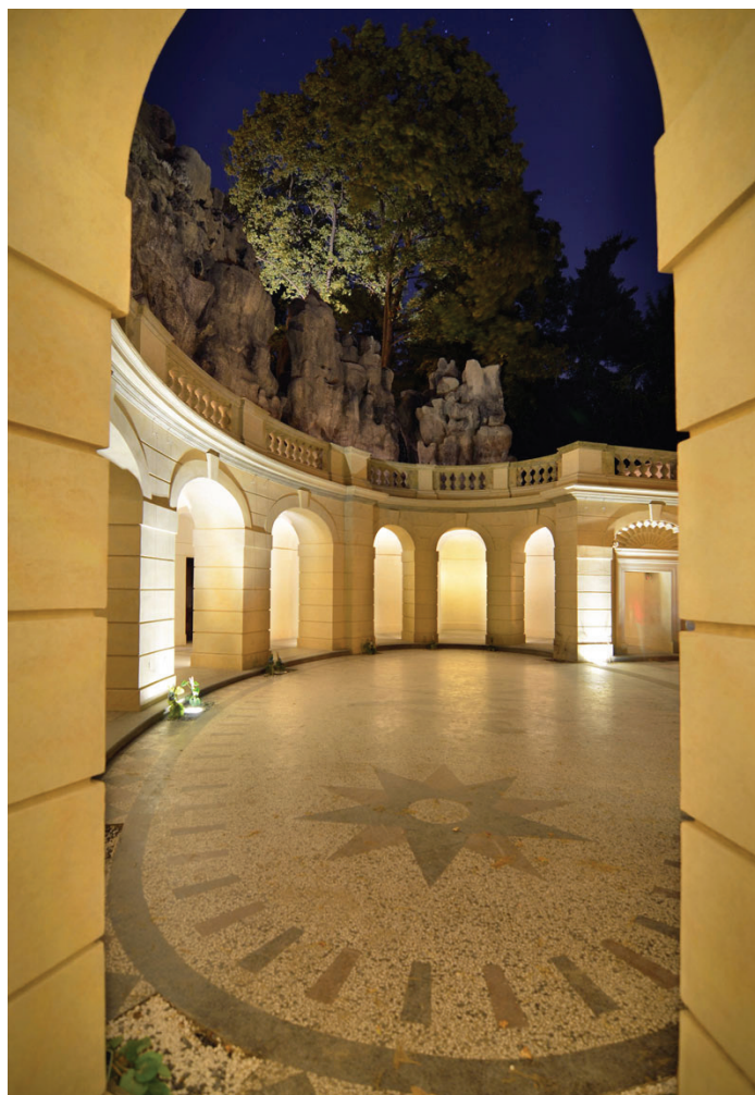
Praha, Havlíčkovy sady, Grotta Autor: Akad. arch. Jiří Javůrek, Ing.arch. Vladimír Thiele / SGL Projekt