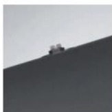
Výměnná jednotka LED