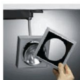
Dva upevňovací šrouby; dva pojistné šrouby