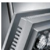
Nastavení sklonu ±±15°