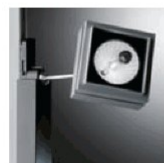
Demontovatelná deska s elektrovýboj