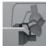
Svítidla lze vyklápat a otáčet kolem svislé osy