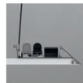
Komponenty svítidel jsou zakryty