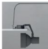
Svítidlo a stavebnicový modul